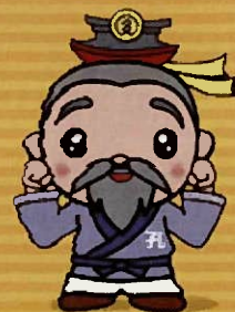
たかし 多久市キャラクター 多久翁さん

「土木」という字をバラバラにすると「土が十一」、「木が十八」となることから11月18日は「土木の日」と言われています。