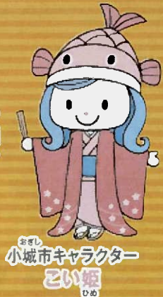
おかし 小城市キャラクター こいね