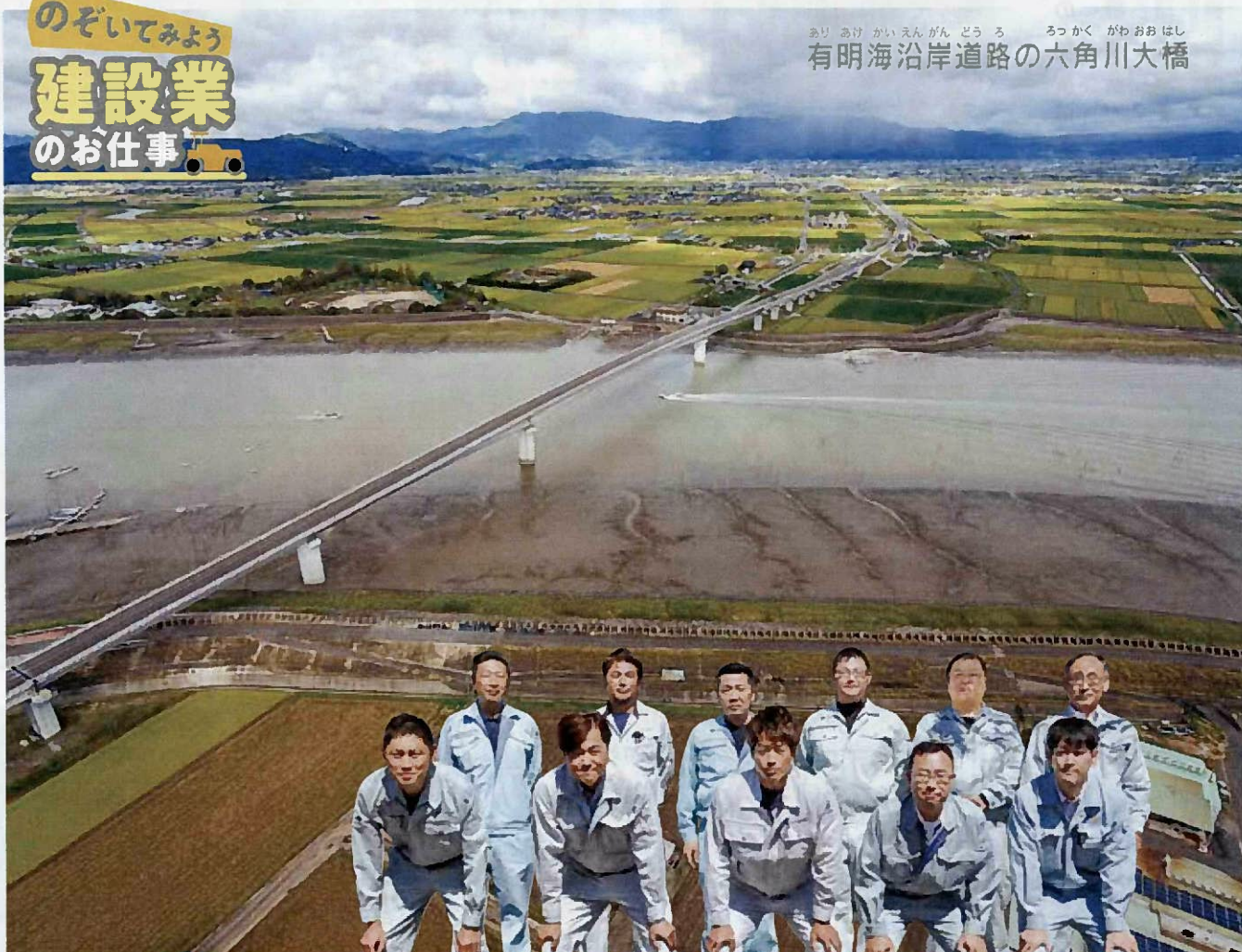
いっしや お ぎ けん せつ ぎやうきやうかいせいなん ぶ (一社)小城建設業協会青年部のみなさん

あり あけ かい えん がん どう ろ ろっ かく がわ おお はし 有明海沿岸道路の六角川大橋